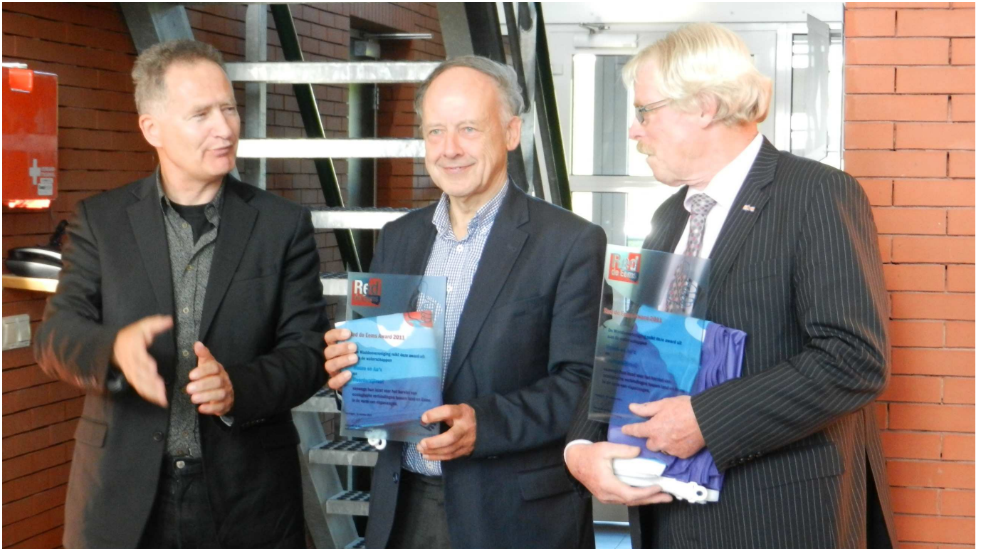
Foto: Verleihung des Ems Award an die „Gemaal Rozema“ in Termunterzijl (NL)

Am 15. Oktober 2011 wurde der Ems-Award an „Gemaal Rozema“ in Termunterzijl verliehen. Sie haben eine Fisch-Passage gebaut, wo es den Wanderfischen ermöglicht wird vom Süßwasser ins Salzwasser zu schwimmen und natürlich umgekehrt. Auch Rettet-die-Ems war dabei und konnte sich die unterirdische Fisch-Straße ansehen.